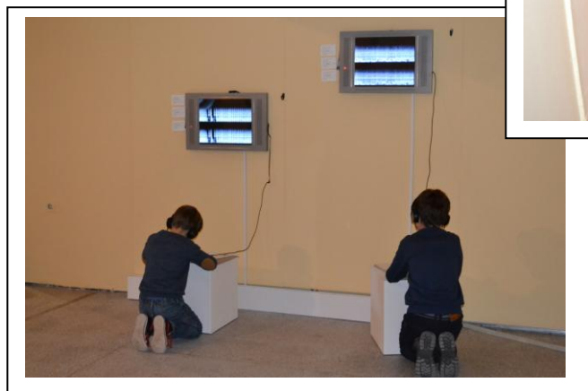
Izložba zvuka: za različite posetioce